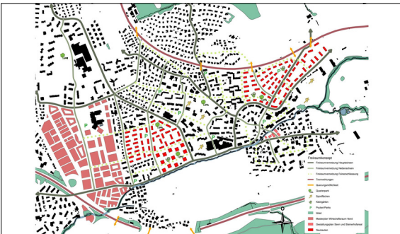
Freiraumkonzept Eigene Darstellung auf Grundlage GIS Zürich

Ergebnis: Durch den städtebaulichen Entwurf kann eine mögliche Entwicklung Urdorfs bis zum Jahr 2050 aufgezeigt werden, welche den erwarteten Bevölkerungszuwachs aufnehmen kann. Gleichzeitig bietet der Entwurf grosszügige Freiflächen, welche je nach Bedarf zu einem späteren Zeitpunkt weiter verdichtet werden können. Möglich wurde dies durch eine Reduzierung der Anzahl an Gebäuden sowie einer Erhöhung der zugelassenen Geschosshöhen bzw. Gebäudehöhen. Mit dem ausgearbeiteten städtebaulichen Entwurf entsteht so ein dichteres Wohnen mit mehr Aufenthalts- und Begegnungsorten für deutlich mehr Menschen.