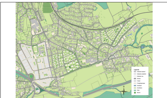
Städtebaulicher Entwurf 2050 Eigene Darstellung auf Grundlage GIS Zürich