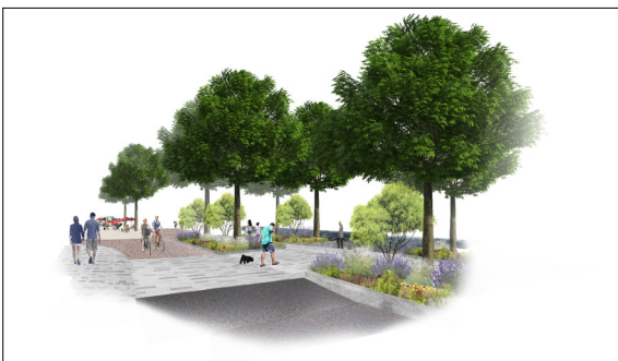
Visualisierung Stadtpuls Kaserne Eigene Darstellung

Einleitung: In meiner Bachelorarbeit befasste ich mich mit einem der wichtigsten Freiräume der Stadt Basel, das Rheinbord. Der Rhein ist in der ganzen Schweiz und in weiten Teilen Europas eine Lebensader. Unzählige Städte und Dörfer haben sich am Rhein angesiedelt so auch Basel. Der Rhein ist Transportweg, Lebensraum für Flora und Fauna, Wasserressource, Freiraum, Touristenattraktion, Energielieferant und vieles mehr, deshalb ist es auch wichtig sich mit dem Uferaum zu beschäftigen und sich fragen wie dieser Raum gestaltet und genutzt werden soll.