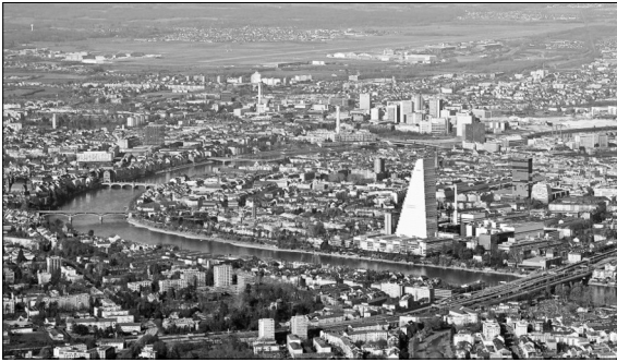
Der Rhein von oben https://ais.badsche-zeitung.de/piece/0a/56/2c/c1/