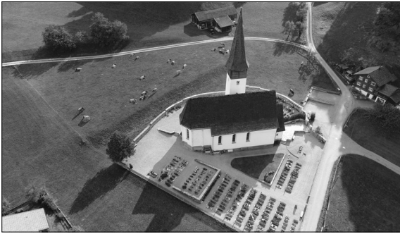
Aktuelle Luftaufnahme des Friedhofs Kirchgemeinde Jenaz

Ausgangslage: Jenaz – im Prättigau, Kanton Graubünden, steht für hügelige Kulturlandschaften und einen malerischen Walser Dorfkern aus dem 14. Jahrhundert. Mit der Dorfgründung entstand auch die reformierte Kirche, sorgfältig zwischen Dorfrand und dem Kulturland auf postglazialgeprägten Schotterterrassen eingebettet. Die Kirche wird von einem Friedhof umschlossen, auf dem seit jeher die BürgerInnen von Jenaz bestattet wurden. Trotz lokalem Traditionsbewusstsein ändern sich die Anforderungen an den Friedhof. Immer weniger der 1200 EinwohnerInnen lassen sich zeichenhaft in einem konventionellen Reihengrab mit Grabstein bestatten. Dies hat zur Folge, dass sich die Platzverhältnisse, Nutzungsanforderungen und das Erscheinungsbild des Friedhofs in Zukunft verändern werden.