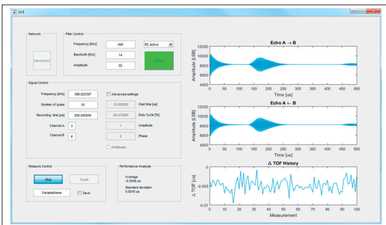
Mit Matlab gestaltete Grafikoberfläche für die Sensoransteuerung und Datenausgabe

Vorgehen: Es werden ein Ultraschallsensorsystem und ein Windkanal für dessen Verifizierung entwickelt und hergestellt. Zunächst erfolgt die Einarbeitung in die Theorie der Volumenstrommessung. Darauf aufbauend wird das Sensorsystem entwickelt. Es ist aus zwei Transducern, einem PCB, einem FPGA-Entwicklungsboard und einem Computer aufgebaut. Das PCB besteht aus einer Transduceransteuerung und einer analogen Signalaufbereitung. Die Signalaufbereitung verstärkt, filtert und digitalisiert das empfangene Signal. Es wird je ein RC-, SC- und GmC-Filterpfad für einen Performancevergleich realisiert. Die komplette Steuerung des PCB und die Datenübertragung an den Computer werden von dem FPGA-Entwicklungsboard übernommen. Mit Matlab wird auf dem Computer der Volumenstrom aus dem digitalisierten Signal berechnet und in einem GUI ausgegeben. Nach der Fertigstellung des Sensorsystems werden zuerst die verschiedenen Strukturen einzeln getestet und danach das komplette Sensorsystem am Windkanal verifiziert und validiert.