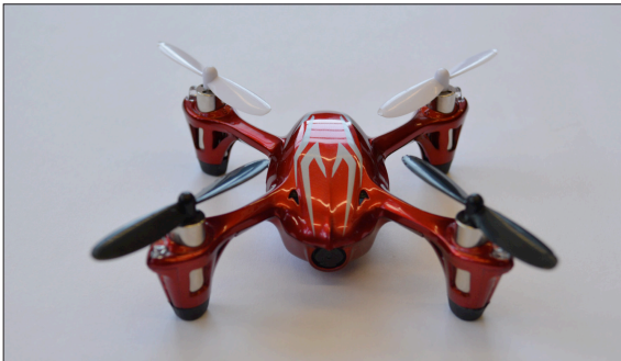
Abbildung 1: Quadrocopter Hubsan X4

Aufgabenstellung: Der Quadrocopter kann für verschiedenste Anwendungen eingesetzt werden. Die Luftbildfotografie und der Transport von leichten Gütern in schwer zugängliche Gebiete sind nur zwei Beispiele der vielseitigen Einsatzmöglichkeiten. Es wurden bereits einige Bachelor- und Studienarbeiten zu diesem Themenbereich an der HSR durchgeführt. Sensorik und Regelung wurden bei diesen Arbeiten direkt auf dem Quadrocopter montiert. In dieser Arbeit soll eine Positionsregelung für einen ferngesteuerten Quadrocopter entwickelt werden. Dabei soll mit Hilfe einer externen Sensorik die Position erfasst und geregelt werden. Zu den intern stabilisierenden Inertialsensoren soll eine überlagerte Regelung implementiert werden, die es erlaubt, eine definierte Position zu halten.