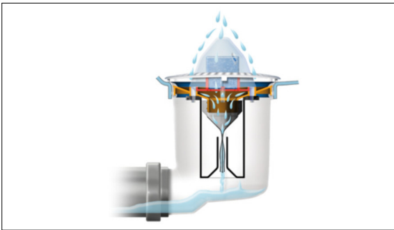
Geruchsverschluss der Urimat Urinale wie er von Urin durchströmt wird. www.urimat.ch

Ausgangslage: Die Urimat Schweiz AG ist seit 20 Jahren weltweit führend in der Entwicklung, Herstellung und Vermarktung von wasserlosen Urinal-Systemen. Die Urinale von Urimat arbeiten mit einer Geruchsverschlussmembran. Die Hauptkomponente der Urinale ist der Geruchsverschluss («Trap»), der aus verschiedenen Kunststoff-Komponenten sowie einem Beckenstein (WC-Stein) und einem Schlauchmembranventil besteht. Das Schlauchmembranventil öffnet sich bei der Flüssigkeitszufuhr und schliesst sich anschliessend wieder, und verhindert somit eine Geruchsbelästigung. Der Beckenstein eliminiert Gerüche, wirkt sich positiv auf die Reduktion von Ablagerungen aus und dient als optische Anzeige zum Wechseln des kompletten Geruchsverschlusses. Zur Wirtschaftlichkeitsbetrachtung ist für viele Kunden eine Information über die Lebensdauer des Geruchsverschlusses (vor allem des Beckensteins) erforderlich. In der Praxis ist die Lebensdauer jedoch von vielen Faktoren, wie Benutzerhäufigkeit, Urinzusammensetzung, Reinigungshäufigkeit, Urinvolumen, etc. abhängig.