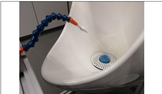
Versuchsstand im Betrieb mit einem handelsüblichen Beckenstein. Eigene Darstellung

Ausgangslage: Die Urimat Schweiz AG ist seit 20 Jahren weltweit führend in der Entwicklung, Herstellung und Vermarktung von wasserlosen Urinal-Systemen. Die Urinale von Urimat arbeiten mit einer Geruchsverschlussmembran. Die Hauptkomponente der Urinale ist der Geruchsverschluss («Trap»), der aus verschiedenen Kunststoff-Komponenten sowie einem Beckenstein (WC-Stein) und einem Schlauchmembranventil besteht. Das Schlauchmembranventil öffnet sich bei der Flüssigkeitszufuhr und schliesst sich anschliessend wieder, und verhindert somit eine Geruchsbelästigung. Der Beckenstein eliminiert Gerüche, wirkt sich positiv auf die Reduktion von Ablagerungen aus und dient als optische Anzeige zum Wechseln des kompletten Geruchsverschlusses. Zur Wirtschaftlichkeitsbetrachtung ist für viele Kunden eine Information über die Lebensdauer des Geruchsverschlusses (vor allem des Beckensteins) erforderlich. In der Praxis ist die Lebensdauer jedoch von vielen Faktoren, wie Benutzerhäufigkeit, Urinzusammensetzung, Reinigungshäufigkeit, Urinvolumen, etc. abhängig.