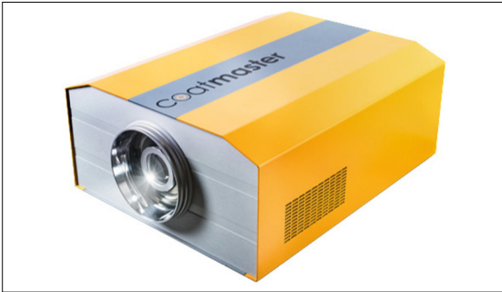
Coatmaster von Winterthur Instruments AG. Messgerät für thermische Schichtprüfung. Winterthur Instruments AG