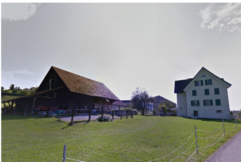
Wohnhaus mit Stall

Ergebnis: In der Auswertung wird die Wirtschaftlichkeit, aber auch die Umweltverträglichkeit, wie Primärenergie und CO 2 -Emissionen der Systeme überprüft und grafisch ausgewertet. Zum Schluss wird eine Empfehlung für den Eigentümer abgegeben. Diese kann jedoch je nach Präferenz des Eigentümers variieren.