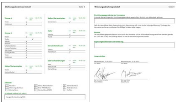
Dokument, wie es nach dem Abschluss der Erfassung erstellt wird.

Ausgangslage: Seit Tablets massentauglich geworden sind, gehören sie zu unseren ständigen Begleitern. Je länger, je mehr werden diese nicht nur zu privaten Zwecken verwendet, sondern sie erobern auch die Arbeitswelt. Zusammen mit der W&W Immo Informatik AG soll eine Lösung entwickelt werden, die es Verwaltern ermöglicht, die Abnahme von Wohnungen und Häusern mithilfe eines Tablets durchzuführen. Das Ziel ist, dass der Verwalter vor Ort von der Zusammenstellung der Wohnung über das Vermerken von Kommentaren bis zur Unterschrift, dem Erstellen eines Dokuments und dem Versand per E-Mail alles am selben Gerät und ohne Papier erledigen kann.