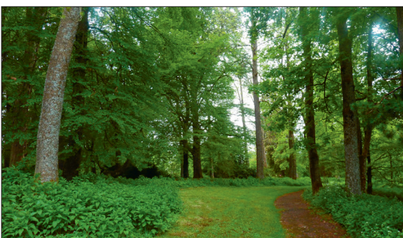
Parc Gallet, aktuelle Fotografie