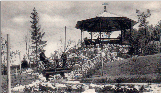
Parc des Crêtets, Fotografie um 1910

Ausgangslage: Der Stadtpark von La Chaux-de-Fonds besteht aus zwei Teilen, die sich im Laufe der Jahrzehnte zu einem Stadtpark entwickelten. Der Parc des Crêtets entstand zu Beginn des 20. Jahrhunderts als öffentlicher Park. Er ersetzte den Place de la Gare, der im Zuge des Bahnhofsneubaus weichen musste. Der Parc des Crêtets wurde im Stil eines späthistorischen Landschaftsgartens angelegt, mit einem landschaftlichen Charakter und ersten Zügen eines Reformgartens. Der Parc Gallet wiederum war bis ins Jahr 1925 in Privatbesitz. Er hat einen ursprünglichen, waldähnlichen Charakter.