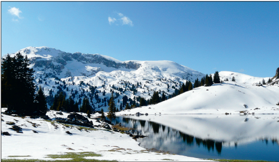
Der malerische Seebergsee liegt in einem Naturschutzgebiet oberhalb von Zweisimmen und ist ein beliebtes Ausflugsziel