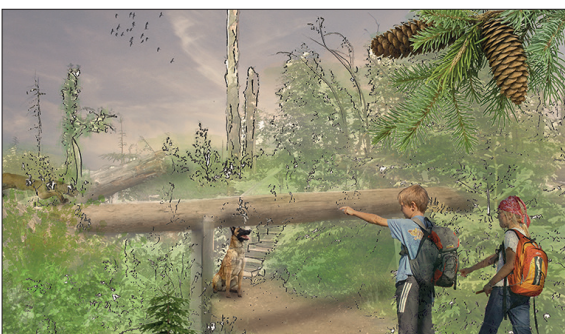
Der neue Waldlehrpfad im Meniggrund führt durch das Grosswaldreservat und lässt die Besucherinnen und Besucher die dynamische Waldentwicklung hautnah erleben

Aufgabenstellung: Das Diemtigtal ist im Winter ein Eldorado für Skitourengehenden und -gänger sowie für Schneeschuhwanderer. Im Sommer wird das Tal rege von Wanderern, Bikern und Kletterern genutzt. Vor diesem Hintergrund plant der regionale Naturpark Diemtigtal den Aufbau eines Kompetenzzentrums Natursport. Die Aufgabe der Arbeit besteht darin, Vorschläge zu machen für die Verknüpfung des neuen Kompetenzzentrums mit den Natursportaktivitäten und den Naturerlebnisangeboten in der sensiblen Alpenlandschaft des Diemtigtals. Zudem wurde vor einigen Jahren im Diemtigtal ein Grosswaldreservat eingerichtet. Für die beteiligten Körperschaften und für die Gemeinde Oey-Diemtigen stellt sich nun die Frage, wie dieses Waldschutzgebiet zukünftig in Wert gesetzt werden soll.