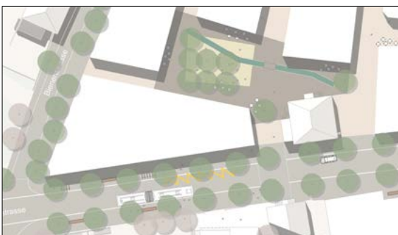
Ausschnitt aus dem Konzeptplan – Dörfliplatz