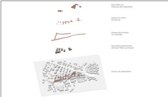
Konzeptschema Bebauungs- und Freiraumstruktur

Ausgangslage: Das Welschdörfli in Chur liegt angrenzend an die Altstadt auf der linken Plessurseite und gehört zum Churer Entwicklungsgebiet. Es charakterisiert sich heute als vielfältiges, bunt durchmischtes Viertel mit grossem Entwicklungspotenzial. Die Nutzung der Freiräume beschränkt sich jedoch lediglich auf die Parkplatznutzung. Durch eine neu gestaltete Platzabfolge soll das Welschdörfli aufgewertet werden und ein eigenständiges Viertel werden.