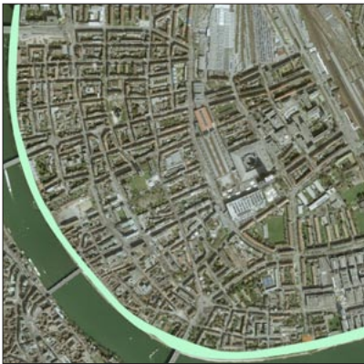
Freiraum am Rheinknie

Das Kleinbasler Rheinufer ist der grösste zusammenhängende Freiraum der Stadt Basel. Dieser Freiraum wird von allen Bevölkerungsschichten genutzt und führt durch verschiedene Stadtteile. Das Rheinufer ist sehr vielseitig erlebbar. Man kann flanieren, joggen, Rad fahren, relaxen oder schwimmen.