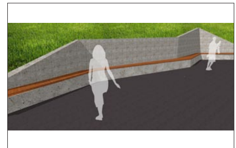
Fragment mit Sitzkonstruktion