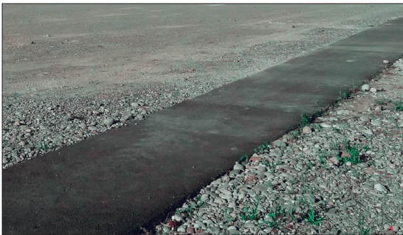
Asphaltwege überformen die Spuren der Geschichte