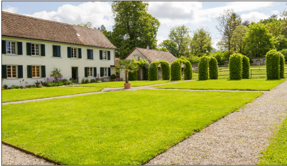
Am Standort des ehemaligen Nutzgartens befindet sich zurzeit ein herrschaftlich anmutendes Rasengeviert.