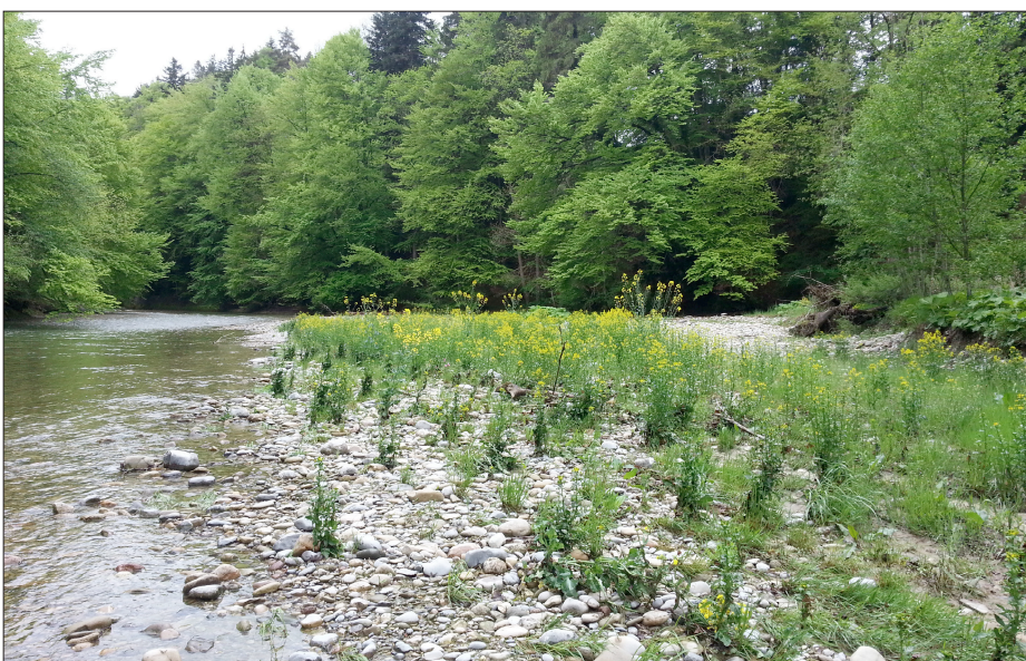
Landschaft des unteren Neckercanyons entdecken

Ergebnis: Ergebnis der Arbeit ist ein durchgehender Neckerweg auf der linken Talseite, wo sich Erholungsuchenden immer wieder Möglichkeiten bieten, einen Abstecher an den Necker zu unternehmen. Entlang des Neckerwegs wird ein Hörpfad eingerichtet, der zur Sensibilisierung und Begeisterung der Erholungsuchenden für die Natur beitragen soll. Für Abenteuerlustige, die den Necker hautnah erleben möchten, werden geführte Wildwanderungen durch den Neckercanyon angeboten.