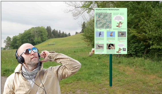
Entlang des Neckerwegs wird ein Hörpfad eingerichtet mit dem Ziel, die Besucher für die Natur zu sensibilisieren und zu begeistern.