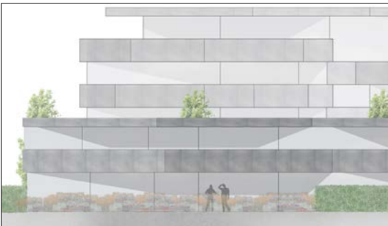
Teilansicht nach Norden

Ausgangslage: Das Gebiet Grünegg liegt an der Kreuzung einer stark befahrenen Hauptstrasse. Es grenzt an den Gasthof Kreuz und befindet sich südlich des Landwirtschaftsbetriebs Chrüzhof, der von einigen Obstbäumen umgeben ist. Anstelle eines abgebrochenen Hauses entsteht eine Wohnüberbauung mit drei Baukörpern. Aufgrund der Hanglage wurde in den nördlichen zwei Gebäuden ein Split-Level eingeführt. Die sehr verwinkelte und fast städtische Fassadenstruktur ermöglicht, dass alle Grundrisse mindestens drei Aussichten zum Bergpanorama der Nordalpen erhalten.