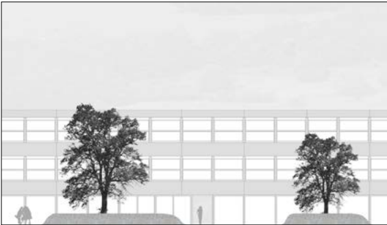
Teilbereich eines Schnittes

Ausgangslage: Die Kantonsschule Heerbrugg ist für die Region Rheintal von grosser Bedeutung. Die bestehende Schulanlage genügt jedoch den heutigen betrieblichen Anforderungen nicht mehr. Das Flächenangebot ist zu klein. Die Schulanlage soll um etwa 2100 m 2 auf eine totale Nettonutzfläche von rund 9000 m 2 erweitert werden. Das Architekturbüro hutter nüesch architekten in Berneck belegte in diesem Projektwettbewerb mit selektivem Verfahren den zweiten Platz. In dieser Bachelorarbeit gilt es nun, den Aussenbereich der Kantonsschule zu planen.