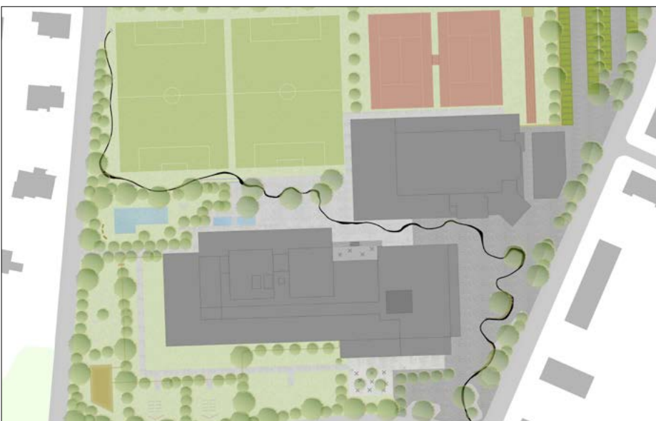
Gestaltungsplan über den ganzen Perimeter

Ergebnis: Damit sich der Aussenraum der Kantonsschule in die Umgebung einfügt, wurde bewusst auf die einzigartige Felderstruktur des St. Galler Rheintals zurückgegriffen. So sollen unterschiedliche Räume entstehen, die sich den verschiedenen Nutzungen anpassen. Die Baumreihen verlaufen entlang der Entwässerungsgräben, wie es in der Feldstruktur üblich ist. Die orthogonale Struktur, die durch die Gehölzreihen wiedergegeben wird, soll durch das fließende Element gestört werden, um so dem Raum Dynamik und Abwechslung zu verleihen. Dieses Element kann von den Schülern nach Belieben eingenommen werden.