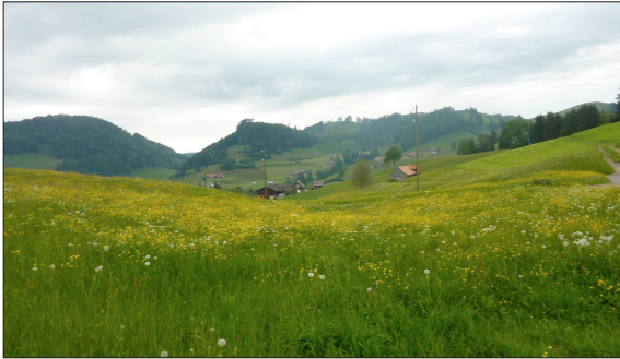
Abwechslungsreiche Landschaft des Dorfes Dicken im Neckertal

Ausgangslage: Momentan ist der Regionale Naturpark Neckertal im sankt-gallischen Toggenburg und in Appenzell Ausserrhoden im Aufbau. Das Neckertal zeichnet sich aus durch ein typisches Mosaik aus Offenland, Wald und Streusiedlungen. Mit dem Naturpark sollen die Landschaft und die Natur des Neckertals aufgewertet werden. Ein neues Angebot für Besucher soll zur regionalen Wertschöpfung beitragen. Zur besseren Lenkung der zusätzlich erwarteten Besucher will die Trägerschaft des Naturparks das Besuchermanagement stärken.