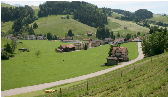
Ehemaliges Stickereidorf Dicken mit der unteren Fabrik und den Arbeiterhäusern

Ziel der Arbeit: Aber auch an kulturellen Attraktionen fehlt es nicht. Die Zeit der Stickerei-Industrie des 19. Jahrhunderts ist heute noch allgegenwärtig, gibt es doch immer noch die Gebäude (Stickereifabriken, Fergger- und Arbeiterhäuser) aus dieser Zeit. Im Dorf Dicken der Gemeinde Neckertal sind diese kulturellen Attraktionen sehr gut erhalten. Sie vermitteln einen speziellen Charakter. Ziel der Arbeit ist es, am Beispiel von Dicken aufzuzeigen, wie diese natürlichen und kulturellen Attraktionen im Rahmen des Besuchermanagements in Wert gesetzt werden können