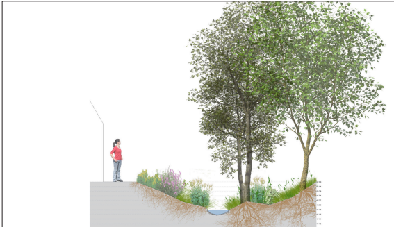
Querschnitt Bachkonzept (Eschlibach) im Abschnitt «Wiesenbach» mit Eschen und Weiden auf Höhe der Ackerstrasse, Berlingen