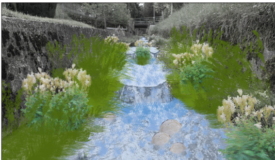
Visualisierung einer Variante für die Umgestaltung der Schwellen am Wildbach

Aufgabenstellung: Die Gewässerplanung von Berlingen ist bereits gut fortgeschritten. Es liegt ein Unterhaltskonzept für alle Bäche der Gemeinde sowie ein Seeuferplan vor. Der Eschlibach liegt am Siedlungsrand. Er bildet die Grenzlinie zwischen einer westlich gelegenen Wohnzone, einer östlich noch unbebauten Gewerbezone und der Landwirtschaftszone. Anwohner wünschen, dass der Eschlibach durch die Überbauung in der Gewerbezone nicht an ökologischem Wert einbüsst. Deshalb wird das Entwicklungspotenzial für die Bäche Eschlibach und Wildbach vertieft ermittelt, und konkrete Vorschläge zur Verbesserung werden aufgezeigt. Dazu wird als Versuch die Methodik von REvital (HSR/ILF) angewendet.