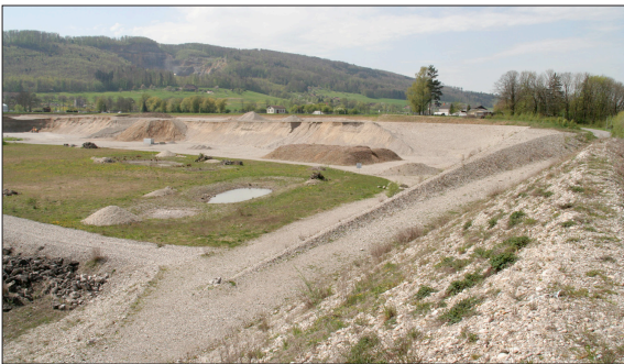
Hier werden in Kürze rund 4000 Menschen wohnen. Der Nutzungsdruck erfordert Lenkungsmassnahmen.

Ausgangslage: Olten befindet sich im Umbruch. Die rund 25 ha grosse Kiesgrube, welche im Südwesten den Oltner Siedlungsrand markiert, wird in Kürze fertig abgebaut sein. Ein Grossteil des ehemaligen Abbaugebietes wird in den nächsten Jahren gemäss «Gestaltungsplanung Olten Südwest» überbaut werden. Die Massnahmen zur Rekultivierung und für einen ökologischen Ausgleich sind weitgehend aufgelistet. Die Bautätigkeit findet in nächster Nähe zu den ökologischen Ausgleichsflächen statt. Das neue Quartier bietet Wohnraum für 4000 Einwohner und Platz für 1300 Arbeitsplätze. Damit wird der Druck auf den Siedlungs- und Naturraum sowie auf das Naherholungsgebiet im Unteren Dünnerental steigen.