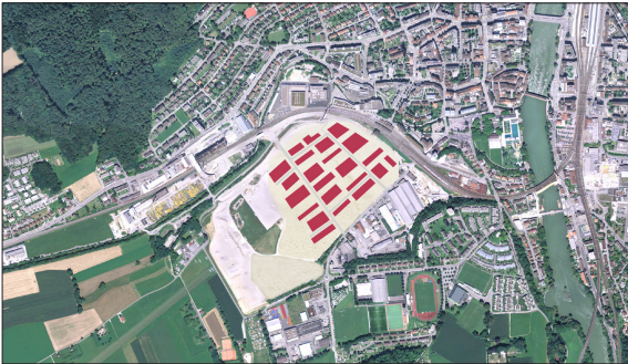
Die Siedlung Olten Südwest wird Oltens Einwohnerzahl um rund 25% erhöhen.