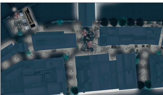
Vorprojektplan des Quartiers de l'Usine mit dem Place des Volontaires; Nachtsituation mit Beleuchtung