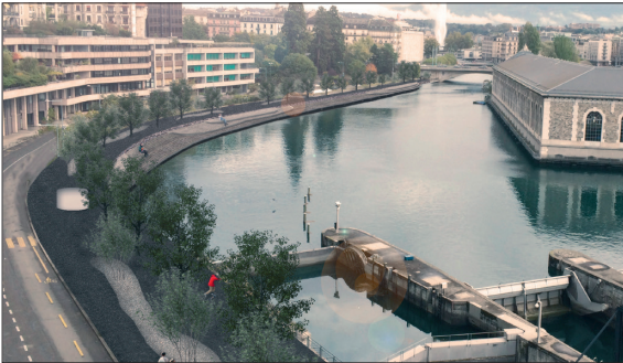
Ausblick Richtung Innenstadt

Einleitung: Das Viertel Jonction ist eines der vielseitigsten und dynamischsten der Stadt Genf. Schauplatz der Geschichte, der Industrialisierung, der Moderne und der Postmoderne. Ein Schauplatz der alternativen als auch der etablierten Kultur. Ein Nebeneinander verschiedener Nutzungen und Ansprüche, denen das Projekt Öffentlicher Raum Jonction gerecht wird. Die durch die Stadt freigesetzten städtebaulichen Impulse breiten sich in Form von Infrastrukturprojekten und genereller Aufwertung des öffentlichen Raums in ein Kerngebiet der Stadt aus. Durch die Einbindung von umliegenden Räumen in das übergeordnete Konzept entsteht ein nahtloser Übergang zu den naturnahen Flussufern der Rhone, zur repräsentativen Innenstadt und zu den neuen Wohnformen des Ecoquartiers.