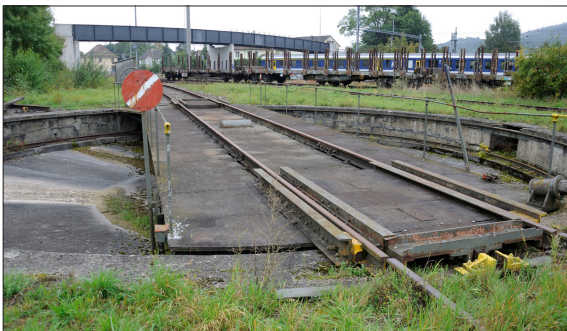
Berühmte Drehscheibe von Etwilen

Ausgangslage: Etwilen – heute ein Teil der Gemeinde Wagenhausen TG – liegt vor der Tür des Tourismusmagnetes Stein am Rhein und war früher als Eisenbahnkreuzungs- und Umsteigepunkt ein weit bekannter Ort. Heute sind von dieser Zeit noch die Nebengeleise und die historische Drehscheibe zu erkennen – ein wenig verlassen liegend in der Talmulde vor dem Rhein. Mit der Planung eines Gewerbegebietes in diesem Teilraum und dem darin anvisierten Geothermiekraftwerk ergeben sich für die Gemeinde neue Herausforderungen, aber auch Chancen. Welche landschaftliche Vision bietet diese Entwicklung der Gemeinde?