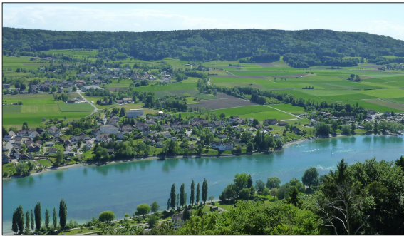
Blick vom anderen Rheinufer auf die Gemeinde Wagenhausen