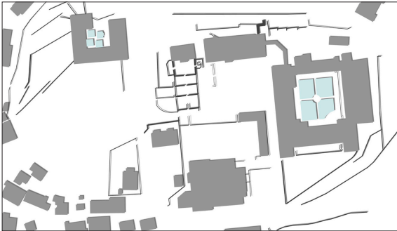
Der Neubau (links) mit den vorhandenen Räumlichkeiten