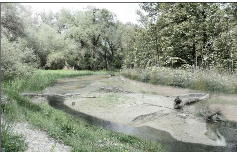
Der Bach im Bereich des Auenwaldes nach der Umgestaltung