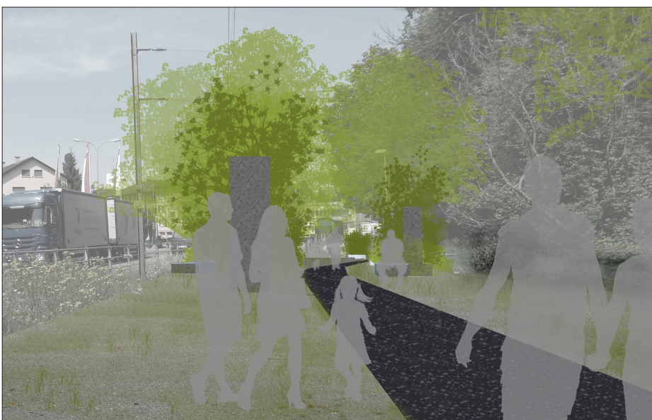
Visualisierung des neuen Erholungsweges

Ergebnis: Die neue Erholungsachse zeigt beim Spazieren zwei Gesichter. Ein immer wiederkehrendes Element, bestehend aus einem Gehölz-Clump und einem Modulsystem aus Betonelementen, lässt den Weg auf zwei ganz unterschiedliche Arten erleben. So flanieren man in Richtung Allmend auf einem «grünen» Weg, geprägt von den einzelnen Gehölz-Clumps. Der Rückweg hinterlässt durch die geradlinigen, kantigen Sitzelemente aus Beton einen viel härteren, städtischeren Eindruck. Die Anzahl der vorkommenden Elemente erzeugt ein Pulsieren des Weges und stärkt so die unterschiedlichen bestehenden Wegabschnitte. Die Gehölz-Clumps verändern ihr Aussehen und ihren Aufbau je nach Charakter der angrenzenden Räume; einzelne Fenster lassen den Spaziergänger in die umliegende Umgebung blicken.