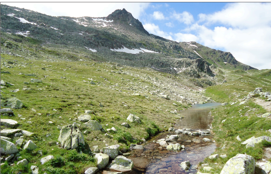
Die weitgehend unberührte Berglandschaft soll als Landschaftsschutzgebiet ausgewiesen werden (Blick auf das Winterhorn)

Ergebnis: Eine aus dem Leitbild hervorgehende Zonierung in je ein ruhigeres und ein aktiveres Teilgebiet trägt dem geplanten Landschaftsschutzgebiet Rechnung. Schutz- und Entwicklungsziele werden skizziert. Je nach Empfindlichkeit und Schutzausweisung werden touristische Nutzung und menschliche Eingriffe angepasst. Entsprechende Massnahmen werden vorgeschlagen und in einem Konzeptplan verortet. Zudem werden angemessene Aktivitäten der landschaftsbezogenen Erholungsnutzung aufgezeigt. Einige davon sind durch Visualisierungen und Referenzbilder genauer beschrieben.