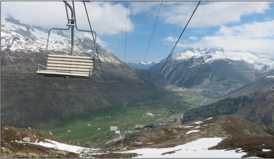
Aussicht auf Andermatt mit dem mittlerweile stillgelegten Sessellift der Sportbahnen Winterhorn

Ausgangslage: Das Skigebiet Winterhorn musste 2007 infolge Insolvenz den Betrieb einstellen. Seither wird das Gebiet im Winter vor allem noch von Skitourengängern und im Sommer von Wanderern genutzt. Nun soll, als Ersatzmassnahme für das Skigebiet Andermatt-Sedrun, am Winterhorn ein Landschaftsschutzgebiet ausgeschieden werden. Um auch die Attraktivität für Erholungsuchende zu steigern, wird zudem ein darauf abgestimmtes naturnahes Tourismuskonzept vorgeschlagen.