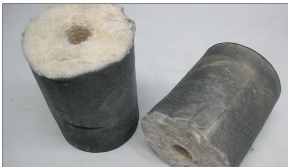
Getestete Filterkerze, welche zur mikroskopischen Untersuchung durchtrennt wurde

Ergebnis: Der Filter zeigt unter den gewählten Versuchsbedingungen auch bei einer sehr hohen Ölverschmutzung mit Partikeln > 1 \mu\text{m} eine konstant hohe Abscheideleistung. Dabei ist bemerkenswert, dass sich der Druckverlauf trotz zunehmender Verschmutzung des Filters durch Feinstpartikel kaum verändert. Darüber hinaus weist das Filtermaterial eine hohe Wasseraufnahmekapazität auf, welche sich günstig auf die Entfernung von Wasser aus Öl auswirkt.