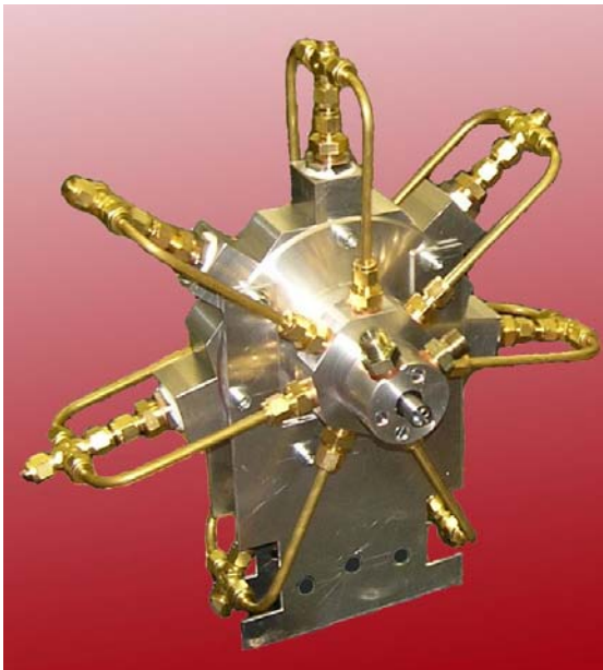
Abbildung: Prototyp der Antriebseinheit

Aufgabenstellung: Der Antrieb von Fahrrädern ist bis heute meist mit einer Kette gelöst. Diese ist immer der Witterung sowie Schmutz wie z.B. Sand ausgesetzt, daher ist der Verschleiss der Antriebsteile enorm hoch. Zudem existieren bis heute keine brauchbaren Antriebskonzepte mit automatischer Gangwahl. Zu dieser Problemstellung wurde in einer vorgängigen Semesterarbeit bereits ein Prototyp einer hydraulischen Antriebseinheit erstellt. Aufgrund festgestellter Mängel muss die Einheit allerdings weiterentwickelt werden. Da im ersten Schritt weder die Steuerung noch die Regelung