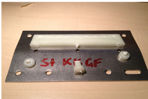
Abb 2: Stahlplatte mit Glasfaserkünststoffrippe: Variante «Kopf Klein» nach Zugversuch