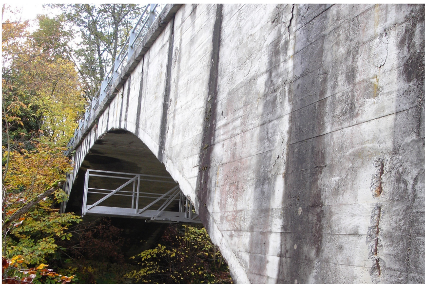
Foto der Twannbachbrücke: Brückenseitenwand Unterwasser.

Ergebnis: Die Tragstruktur weist keine gravierende Schädigung auf, welche die Schliessung, den Abbruch oder Sofortmassnahmen erfordern. Die Instandsetzung der Twannbachbrücke ist mit verhältnismässig geringem Aufwand durchführbar. Die Kosten belaufen sich auf rund Sfr. 400'000. Abhängig von den tatsächlichen Preisen und Massen können die Kosten um ca. 10 % variieren. Die Nutzungsdauer liesse sich somit um weitere ca. 70 Jahre verlängern. Es wird empfohlen, die Brücke instand zu setzen, um sie weiterhin nutzen zu können und um ein Zeitzeuge des Brückenbaus zu erhalten.