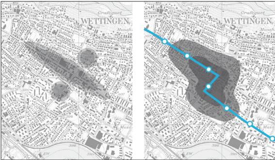
Lage der Zentren heute (links), Verbindung der Zentren durch LTB (rechts)