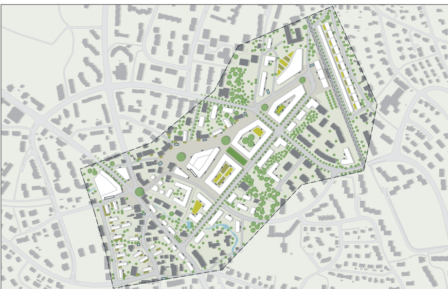
Städtebaulicher Masterplan 2050

Ergebnis: Im Endergebnis entsteht in Seen ein neues Zentrum. Durch eine Steigerung der baulichen und sozialen Dichte soll das Zentrum belebt werden. Der Bevölkerung sollen, vor allem in Anbetracht der starken Verdichtung, Nächsterholungsräume zur Verfügung gestellt werden. Die städtebaulichen Fluchten sollen entlang der Kanzleistrasse hart und entlang des Brunnenwegs (Hinterdorfstrasse) weich verlaufen. Damit soll auf die umliegenden Quartiere reagiert werden. Die speziellen Eigenschaften des historischen Ortskerns werden betont und verhelfen Seen zu einer stärkeren Identifikation. Mit dem Bahnhofsgelände entsteht zudem ein Repräsentationsobjekt.