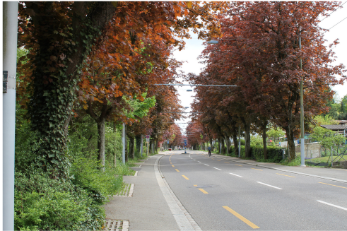
Ziel: Erhalt der Blut-Ahorn-Allee im östlichen Teil