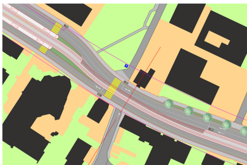
Situation Engstelle Restaurant Frieden

Ausgangslage: Affoltern ist noch nicht an das Tramnetz der Stadt Zürich angeschlossen. Aufgrund des starken Siedlungswachstums und der hohen Verkehrsbelastung der Wehntalerstrasse soll Affoltern nun an das Tramnetz angeschlossen werden. Für die Projektierung ist von einem Eigentrassee für das Tram auszugehen sowie von einer Reduktion von vier MIV-Fahrstreifen auf drei.