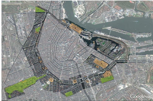
Analyse der Sonderfunktionen auf der Schnittstelle in Amsterdam