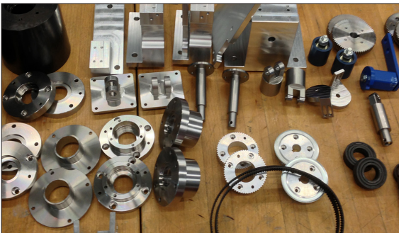
Einzelteile vor dem Zusammenbau

Vorgehen: Zu Beginn der Arbeit musste unverzüglich mit der Überarbeitung der Konstruktion begonnen werden, um die Fertigungsteile rechtzeitig in Auftrag geben zu können. Dafür mussten von allen Teilen die Fertigungszeichnungen erstellt werden. Gleichzeitig wurden bei diversen Lieferanten Offerten eingeholt und die benötigten Teile bestellt. Durch die Identifizierung und frühzeitige Beschaffung der Langläufer konnte ein zeitlicher Engpass verhindert werden. Um die Vorrichtung betreiben zu können, stellte das Institut für Mechatronik und Automatisierungstechnik eine komplette Steuerung zusammen. Nach Erhalt der Teile konnte die Walzkalibriervorrichtung komplett zusammengebaut werden. Da der zeitliche Aufwand für das Zusammenstellen der Steuerung unterschätzt wurde, konnten am Schluss keine Versuche mehr durchgeführt werden.