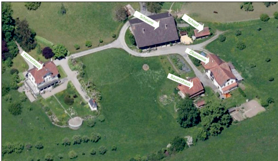
Luftbild vom Landsitz Dorenbach