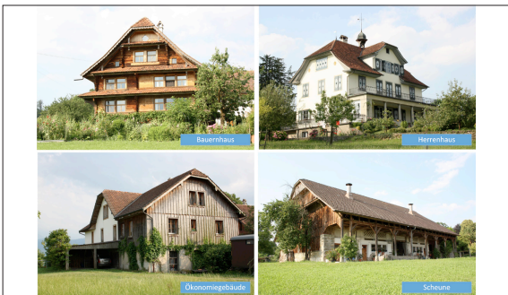
Die untersuchten Gebäude des Landsitzes Dorenbach, LU