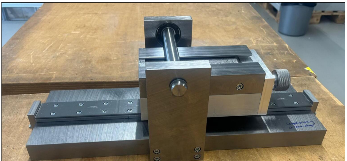
Darstellung der Schälprüfvorrichtung Eigene Darstellung

Dabei konnten sowohl Proben mit hoher Haftung als auch Proben mit sehr geringer Haftung untersucht werden. Durch die Reduktion von Reibungsverlusten sind nun Schälprüfungen im Bereich grösser als 0.15 N/mm möglich.