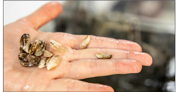
Blick in die Zuleitung mit Quagga-Muscheln (länglichen Elementen) im Seewasserwerk Romanshorn